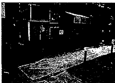
移植した芝生を1ヶ月間、養生しました。壁に沿って作られた花壇はプラスチック製の板で根止めをしています。ひまわり、セージ、マリーゴールド、百日草、アスター等