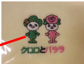
刺繍してあります

※クロロは、市の木「クロマツ」の妖精をモチーフに、バララは、市民の花「バラ」の妖精をモチーフにしたものです。